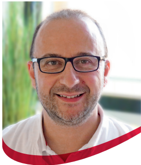
Ideal Jaka, Diabetesversierter Arzt DDG

Diabetes mellitus Typ 2 ist eine tückische Krankheit, die zunächst ohne Anzeichen verläuft und dann schleichend schwere Folgeerkrankungen hervorrufen kann. Man geht davon aus, dass zurzeit etwa 7–8 % der deutschen Bevölkerung unter Diabetes leiden, davon circa 90–95 % unter Diabetes Typ 2. Anders ausgedrückt betrifft die Erkrankung circa sechs bis acht Millionen Menschen in unserem Land, wobei noch